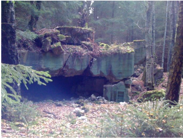
Bunker am Ochsenkopfweg