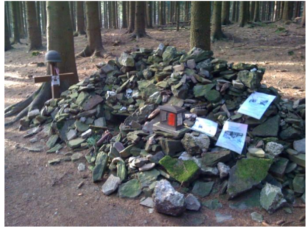
Fundstelle am Ochsenkopf