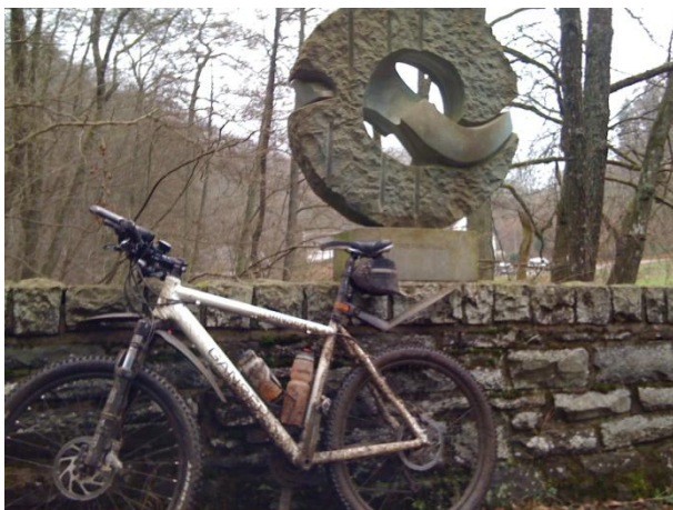
Die Kallbrücke am Kalltrail